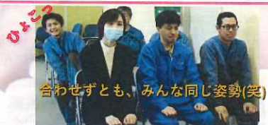
合わせずとも、みんな同じ姿勢(笑)

三和整備の事務所入り口にて 皆さまをお待ちしております ので、会社にいらした際には ぜひ事務所にも立ち寄り ください(〇)／